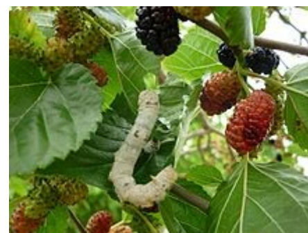
Morus alba con "gusano de seda" ( Bombyx mori ).

L., SP. PL., VOL. 2, P. 986, 1753; [GEN. PL., ED. 5: 424, 1754